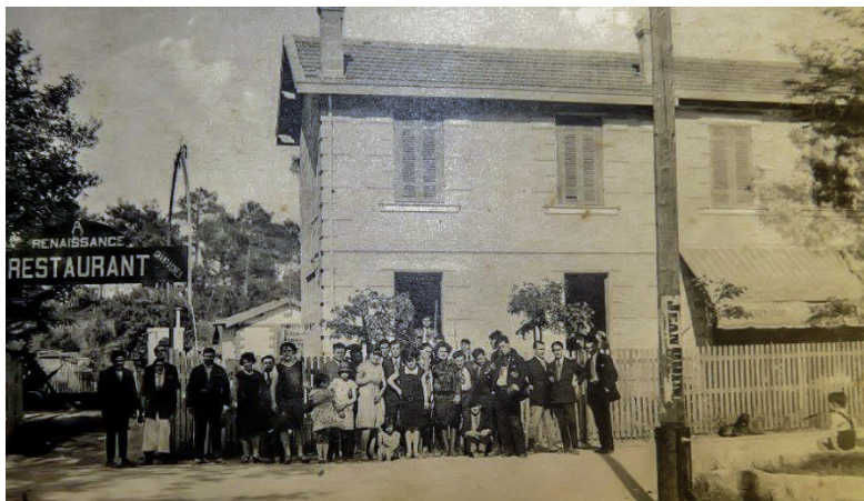
Souvenirs L'hôtel Restaurant « La Renaissance » Actuellement parking en face du Royal

Le Royal Inaugurée en octobre dernier cette salle a été entièrement reconstruite pour offrir à près de 200 personnes assises de beaux spectacles. Il faut s'attendre à revoir surgir les difficultés de circulation connues auparavant lors des spectacles en ce lieu en raison du faible nombre de places de parking aux abords de la salle.