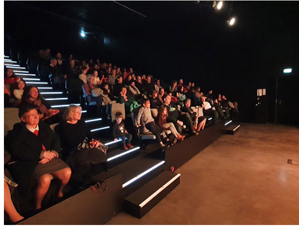
Le public attentif